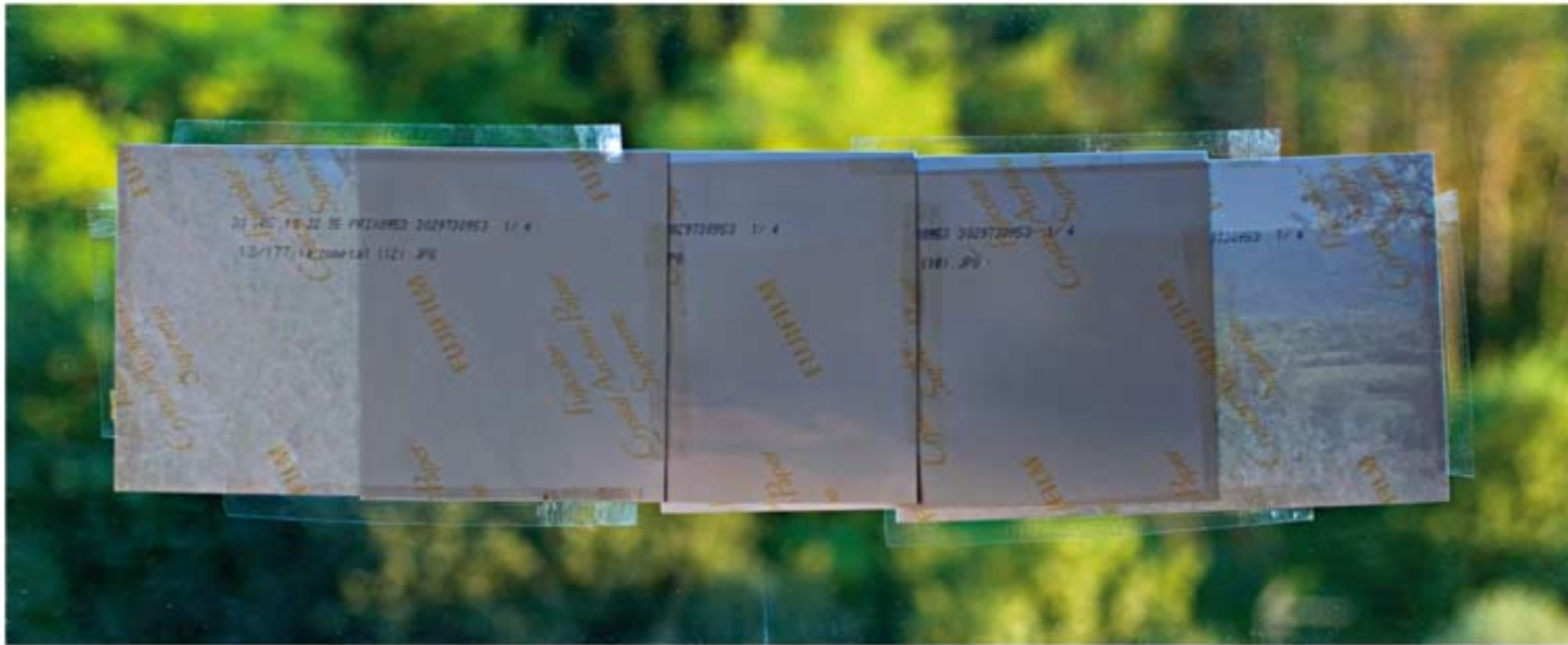
23 x 50 cm.