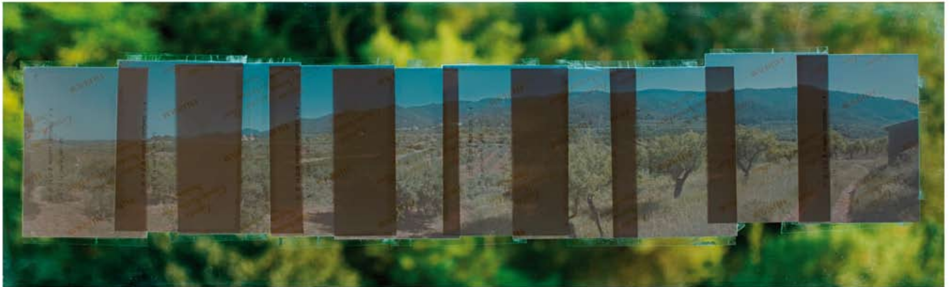
35 x 88 cm.