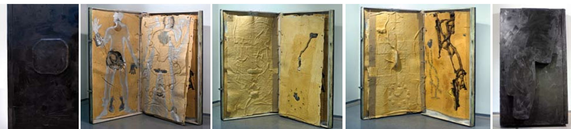
Librez 170 x 122 cm. Fusta, paper i objectes.

Emmagatzemar i transmetre va ser un projecte del 2009. Està compostat de sis llibres-objecte de grans dimensions i una sèrie de quadres, faltant aquest tríptic per tancar el projecte.