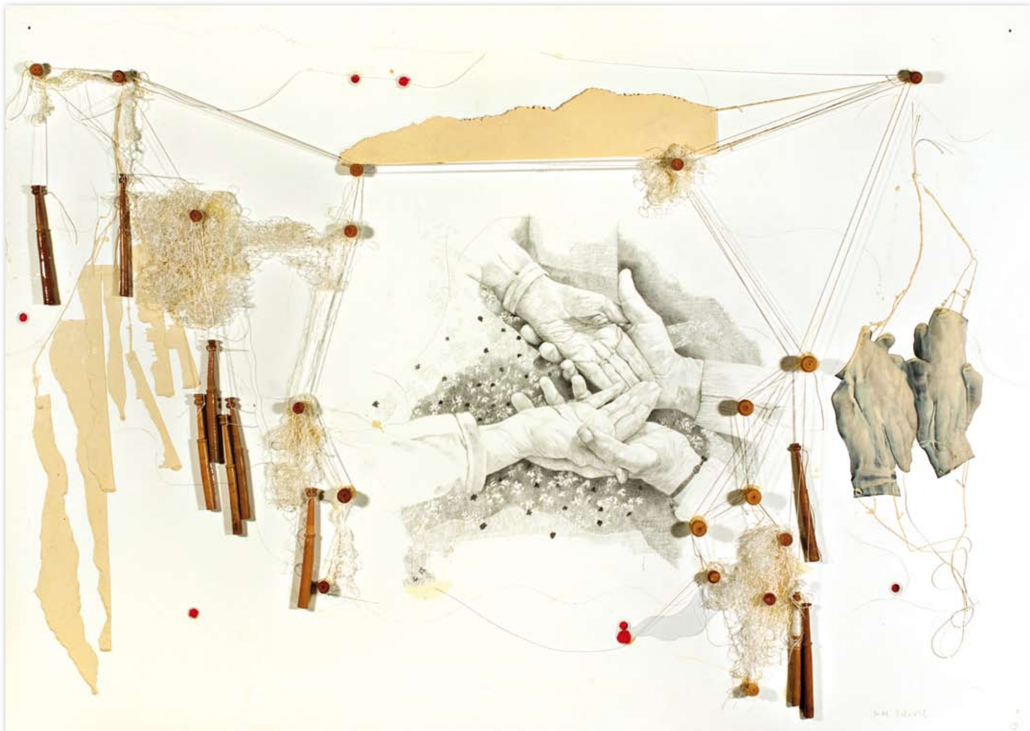
Quico Estivill. Aracné . Dibuix sobre paper, boxets, fils, siluetes de paper i cera. 65 x 85 cm.