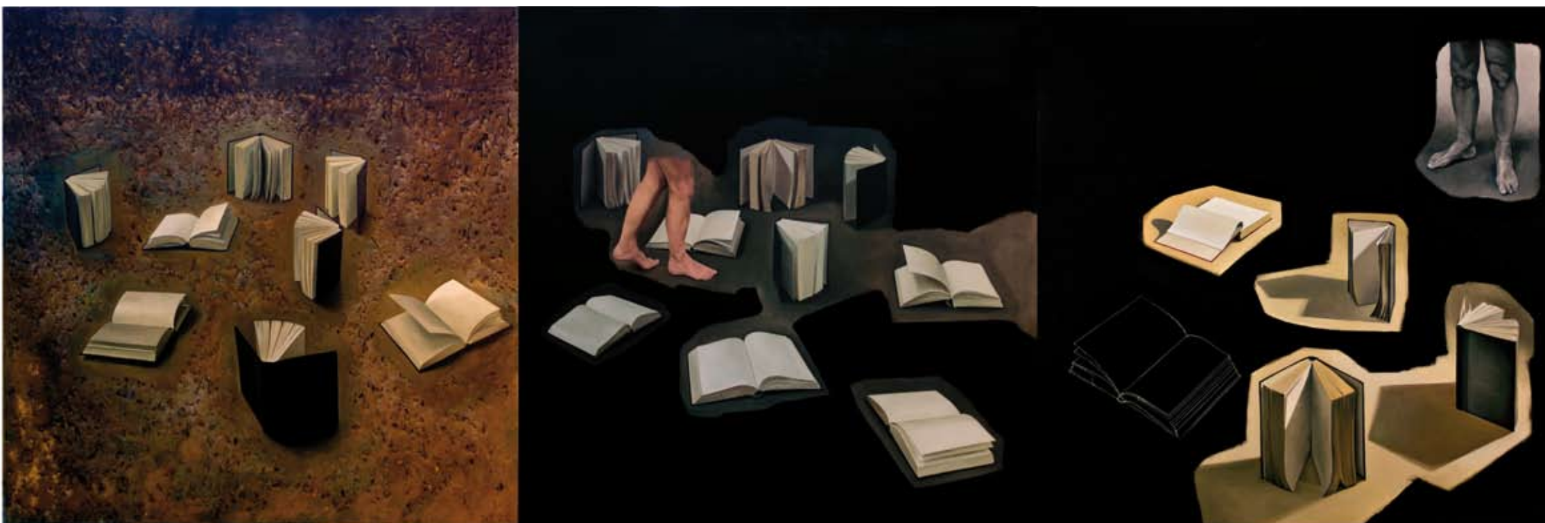
Quico Estivill. Emmagatzemar/Transmetre . Tríptic. Oli sobre tela. 135 x 410 cm.