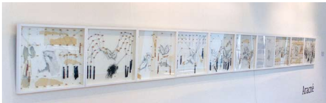
Aracné és una seqüència d'11 dibuixos de 65 x 85 cm cada un i que pertany al treball "Ubicació/Origen". Dos dels dibuixos porten il·luminació incorporada amb leds.